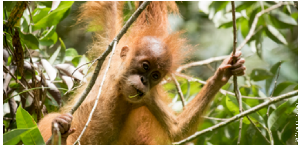
Unten: Ohne umfassende Schutzmassnahmen könnte der Tapanuli-Orang-Utan aussterben, als erste Menschenaffenart in der modernen Geschichte.

Wir setzen uns mehr denn je dafür ein, die wenigen verbliebenen Regenwaldgebiete im Batang Toru-Schutzgebiet zu erhalten, zu stärken und wirksam zu schützen. Gleichzeitig kümmern wir uns um die Versorgung und Rehabilitation verletzter Tiere, sichern ihren Lebensraum durch engagierte Ranger und fördern Forschung sowie Monitoring.